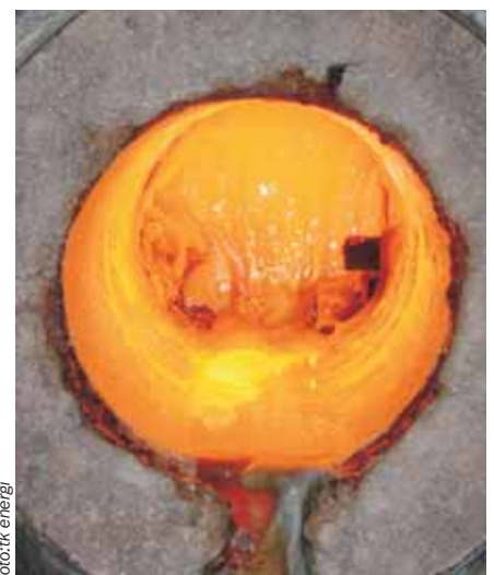
Til højre: Et kig ind i reaktoren på forsøgsanlægget, der blev brugt til forgasning af spildevandsslam. Læg mærke til, hvordan slaggen sætter sig på væggen og løber ud i bunden af reaktoren.