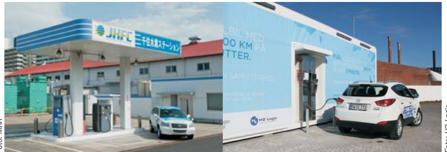
Til højre: En af de i alt 14 brinttankstationer MKK har opført i Japan.