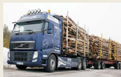
Lastbil fra Volvo til DME.

benzin og diesel. Det indeholder ingen svovl, det soder ikke og mængden af CO, NO x og HC er væsentligt lavere end fra benzin og diesel.