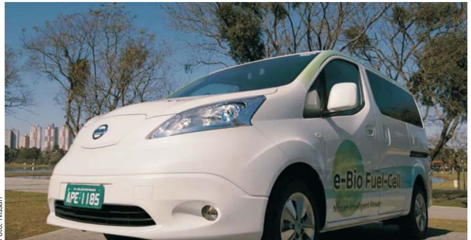
Nissans nye brændselscellebil med bioethanol i tanken.

De giver dog nogle andre udfordringer. Mens alle andre bilproducenter bruger LT-PEM brændselsceller, der arbejder ved temperaturer på under 100 °C, kræver SOFC en arbejdstemperatur på omkring 800 °C. Ved koldstart og korte byture må man således klare sig med batteriet, så bilen henvender sig især til kunder, der har et stort kørselsbehov. Nissan forventer en aktionsradius for bilen på omkring 600 kilometer, og