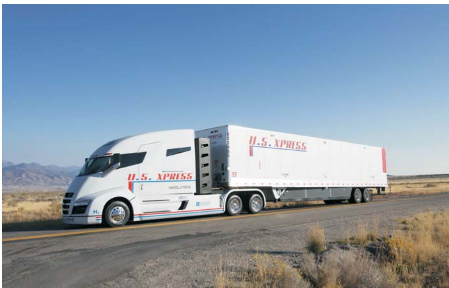
Foto: Nikola One

Den brintdrevne lastbil Nikola One bliver Nikolas flagskib med 2.000 hestekræfter og en rækkevidde på omkring 1.500 kilometer.