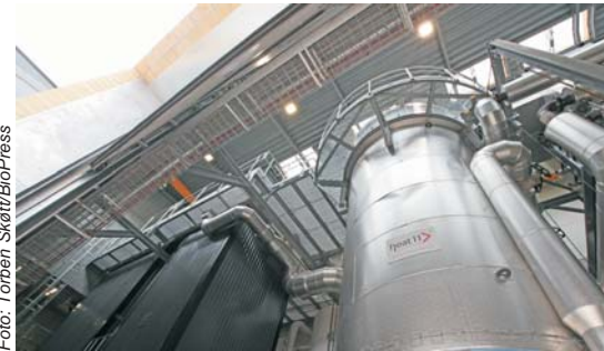
Et kik ind i maskinhallen. Forgasserovnen er de to sorte tårne til venstre.