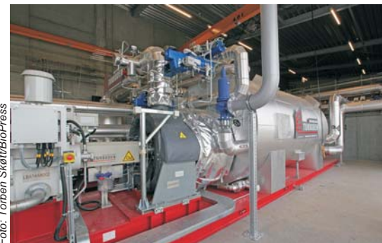
ORC-anlægget fra italienske Turboden kan levere 800 kW el.