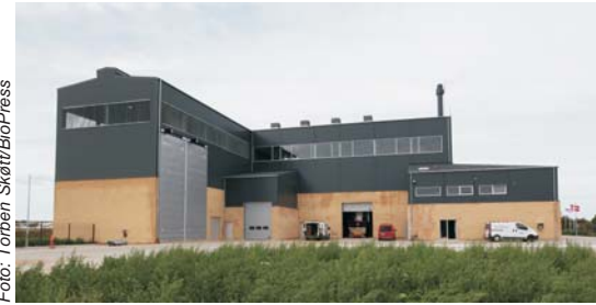
Sindals nye kraftvarmeværk.

Læs mere om Dall Energys teknologi på www.dallenergy.com .