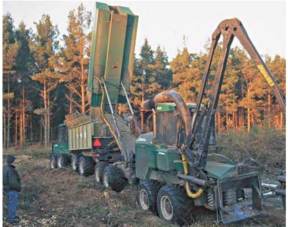
HedeDanmark i færd med at hugge flis i nåltræsskov på Djursland.

– De danske skove kan producere halvanden gange mere energitræ