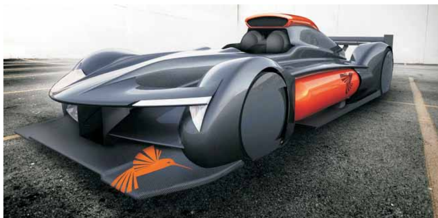
Brintraceren fra GreenGT, der skal være klar til Le Mans i 2013.

Gennem årene er mange teknologier blevet optimeret på Le Mans til gavn for almindelige bilister. Moderne dieslbiler er bare ét eksempel, og nu er turen så kommet til brint.