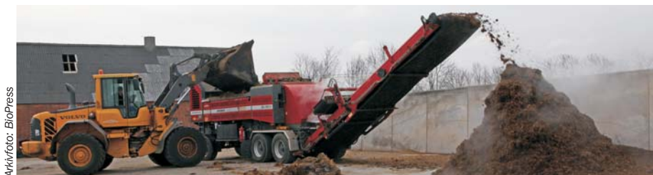
Bedre råvarer i form af blandt andet dybstrøelse har betydet, at gasproduktionen fra Maabjerg BioEnergy nu ligger over budgettet.

– Lastbilerne bliver vejjet, og vi tager prøver af samtlige læs, så leverandørerne bliver afregnet efter både mængde og tørstofprocent. Jo mere