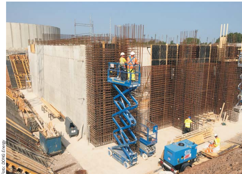
REnescience-anlægget i Northwich, der forventes i drift i begyndelsen af 2017.

– Den videre udvikling af enzymerne skal hjælpe os med en løbende optimering af processen og samtidig udtrække endnu flere værdifulde produkter af affaldet. Det er både godt for miljøet og i forhold til at nedbringe omkostningerne ved affaldsbehandling. Jeg er glad for, at vi i fællesskab også ser på fremtidsperspektiverne