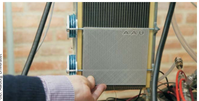
Et lille plastikgitter på 16 x 16 centimeter kan øge virkningsgraden for en brændselscelle med over 30 procent.