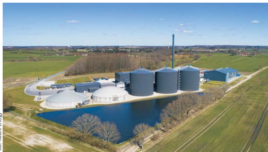
Nature Energys biogasanlæg på Midtfyn.